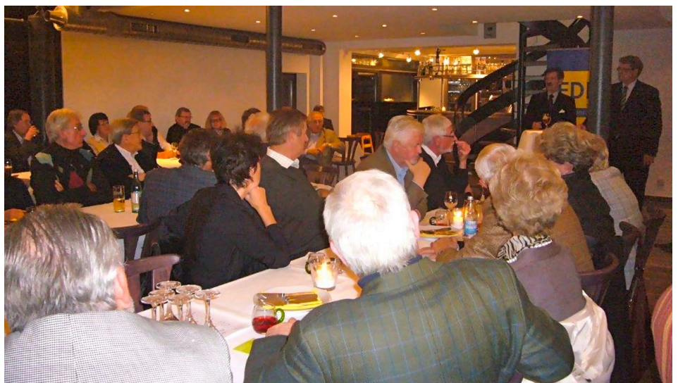
Großes Interesse bei rund 80 Besuchern im Bärensaal in Weinstadt-Endersbach

Der Abend machte eines deutlich: Auch in Zukunft ist in wirtschafts- und finanzpolitischen Fragen mit der Freien Demokratischen Partei zu rechnen.