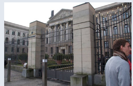
Der Bundesrat in Berlin

Die Ernennung des Cellar Juristen Harald Range zum neuen Generalbundesanwalt ist beschlossene Sache. Der Bundesrat stimmte der Personalie am 4.11.2011 in Berlin einstimmig zu. Das Bundeskabinett hatte bereits grünes Licht gegeben. Range wurde am 17. November in Karlsruhe in sein neues Amt eingeführt. Der Generalbundesanwalt ist in Deutschland die Nummer eins bei der Verfolgung von Terroristen.