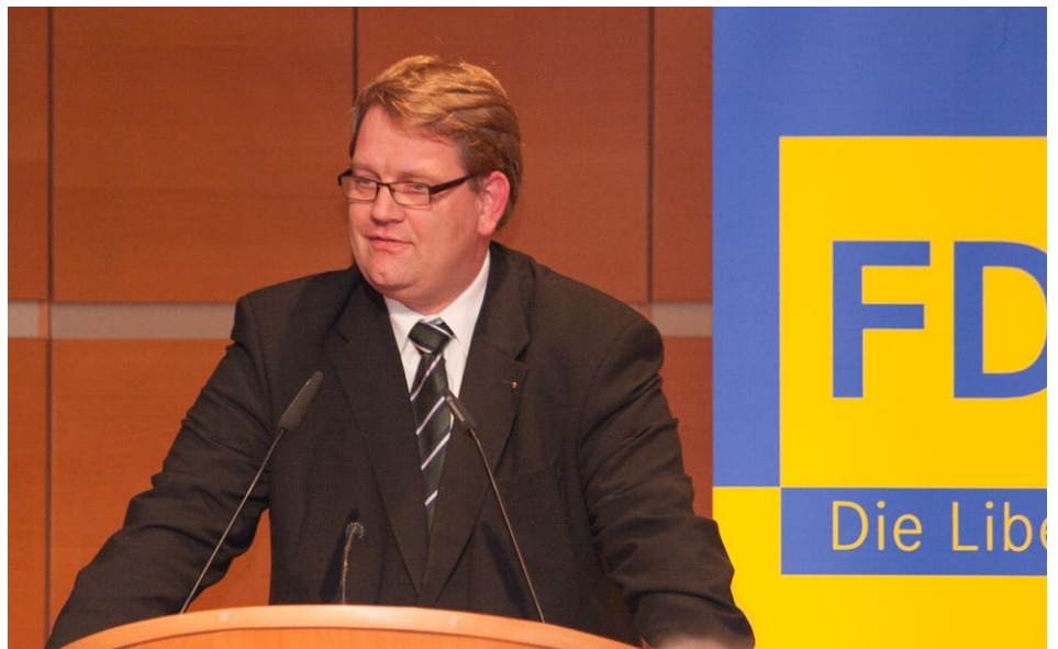
Hartfrid Wolff, MdB beim Neujahrsempfang der FDP Rems-Murr am 30. Januar 2012 im Reinhold-Maier-Saal der Barbara-Künkelin-Halle in Schorndorf bei seinem Grußwort

In letzter Zeit wurde „Wachstum“ vor allem negativ, einschränkend diskutiert – verschleiert durch den Begriff des „nachhaltigen Wachstums“: bei den Grünen, den Sozialdemokraten oder auch bei den