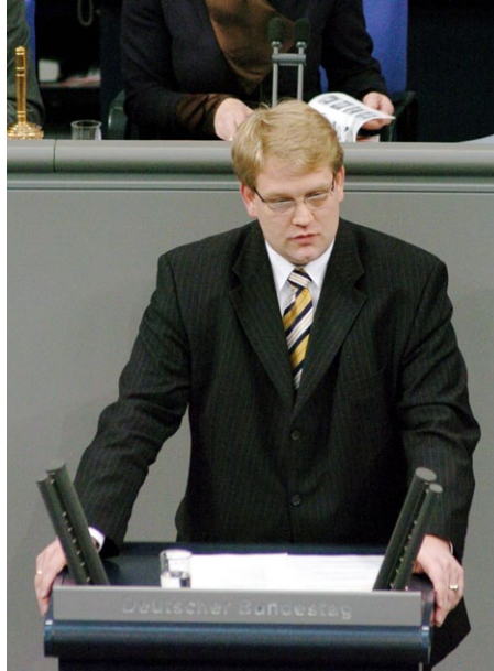
Hartfrid Wolff, MdB im Plenum des Deutschen Bundestages

Die Fragen nach den Konsequenzen sind wir den Opfern, sind wir der schockierten deut-