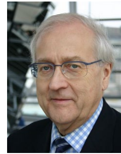
Rainer Brüderle MdB, Vorsitzender der FDP-Fraktion im Deutschen Bundestag.

Berlin, 07.02.2012 - FDP-Fraktionschef Rainer Brüderle hat sich für einen Verbleib Griechenlands in der Euro-Zone aber für mehr Anstrengungen des Mittelmeer-Landes ausgesprochen. In der SWR-Talkshow "2+Leif" sagte Brüderle: "Das Kernproblem Griechenlands ist, dass es nicht wettbewerbs-